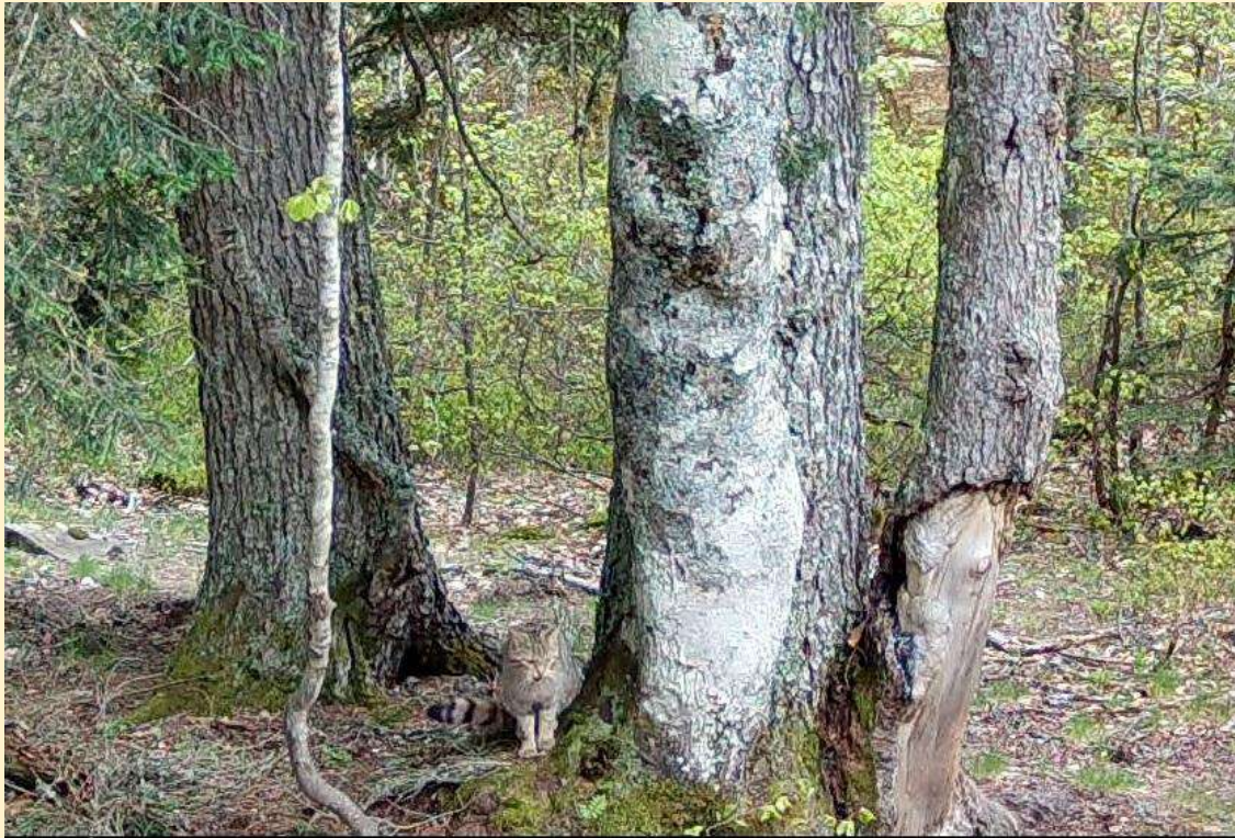
Chat forestier, au pied de l'arbre, 24/05/2024