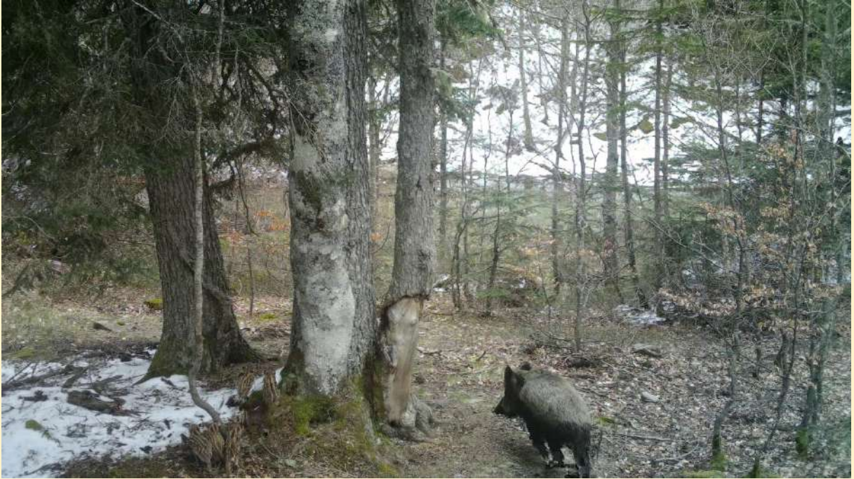
Laie avec tous petits marcassins, au pied de l'arbre, le 24/04/2024