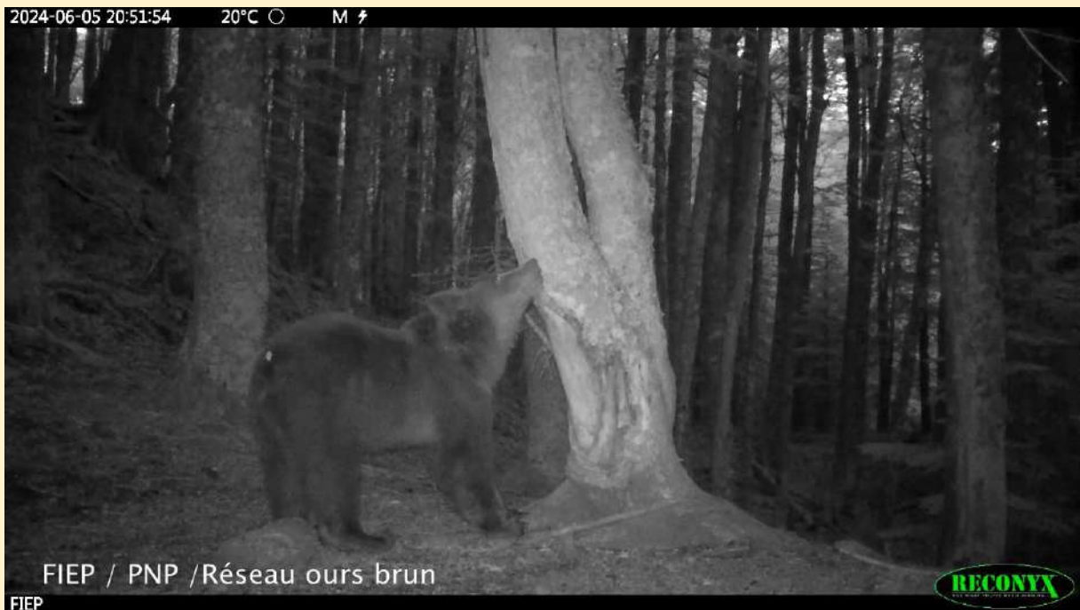
Jeune ours, né en 2024, le 05/06/2024