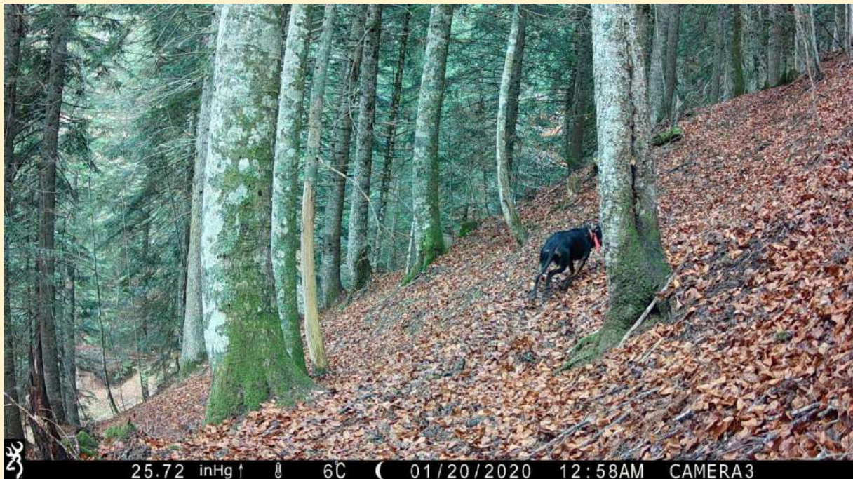
Chien de chasse, le 10/11/2024