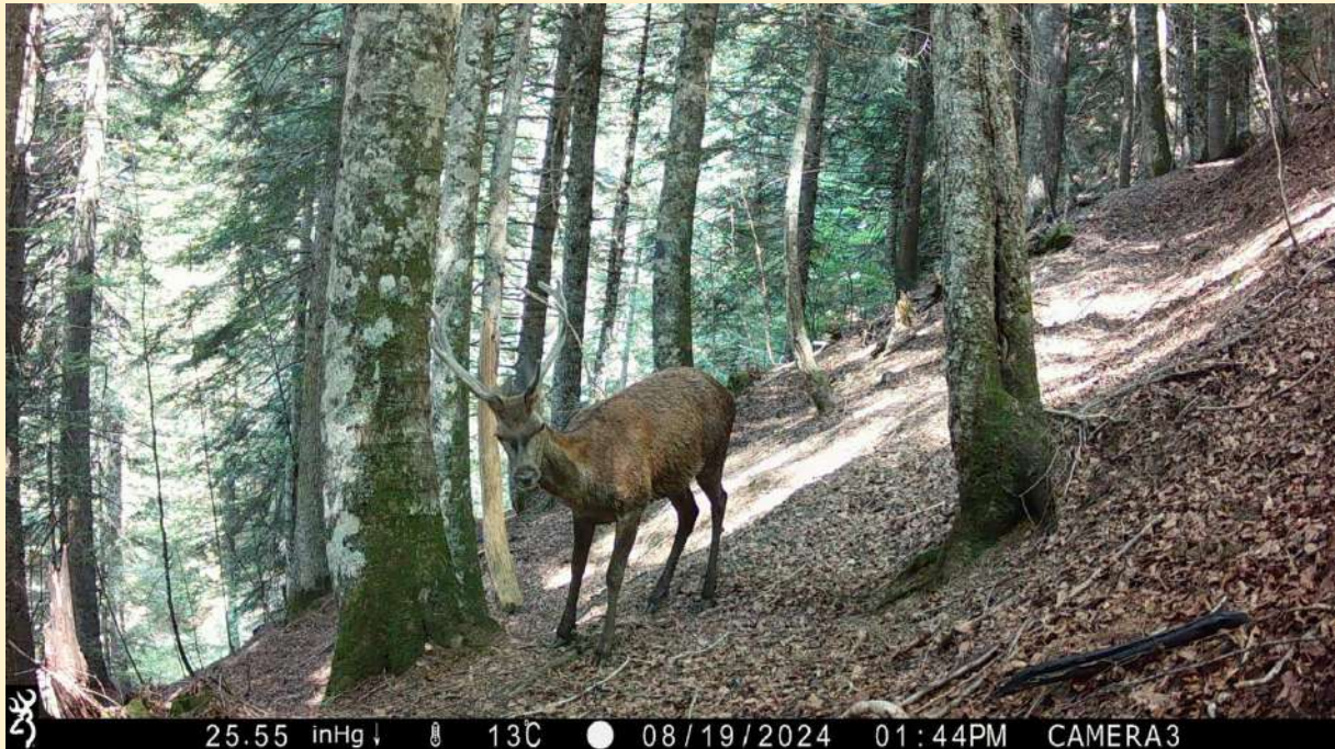
Cerf mâle adulte, avec cornes normales, le 19/08/2024