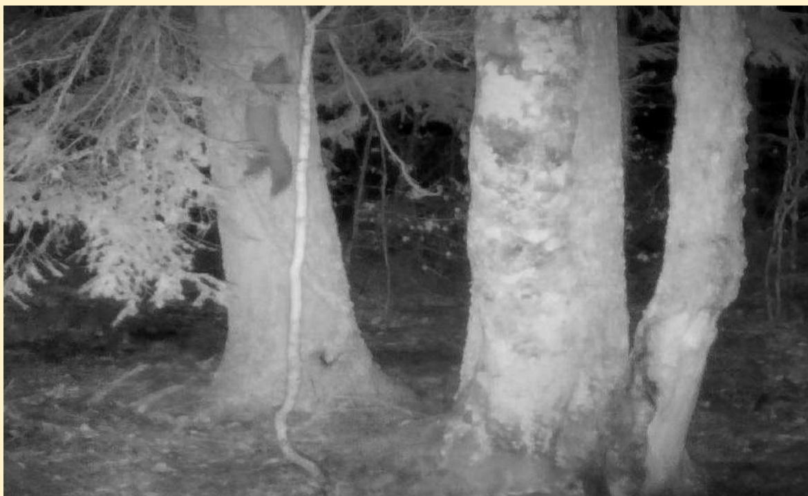
Martre grimpe à l'arbre, le 21/11/2024