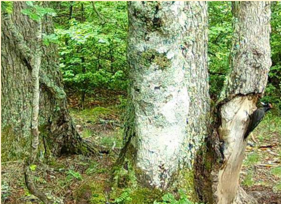
Pic noir, le 23/06/2024