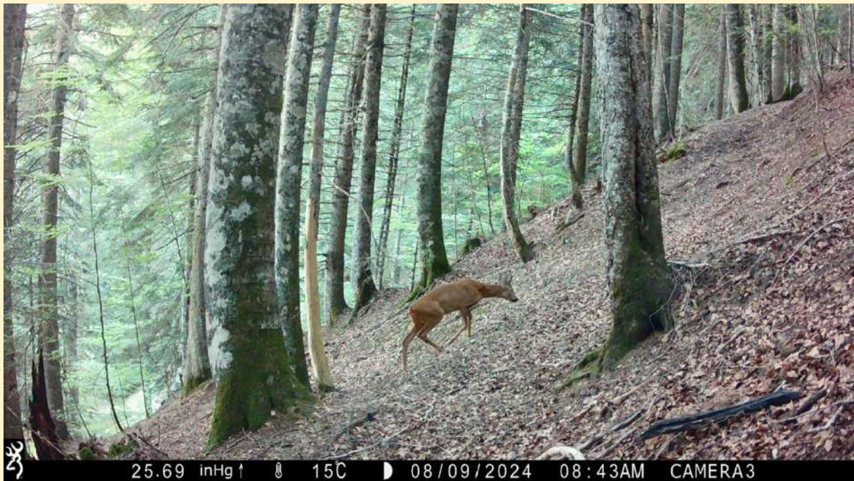
Chevreuil mâle, le 09/08/2024