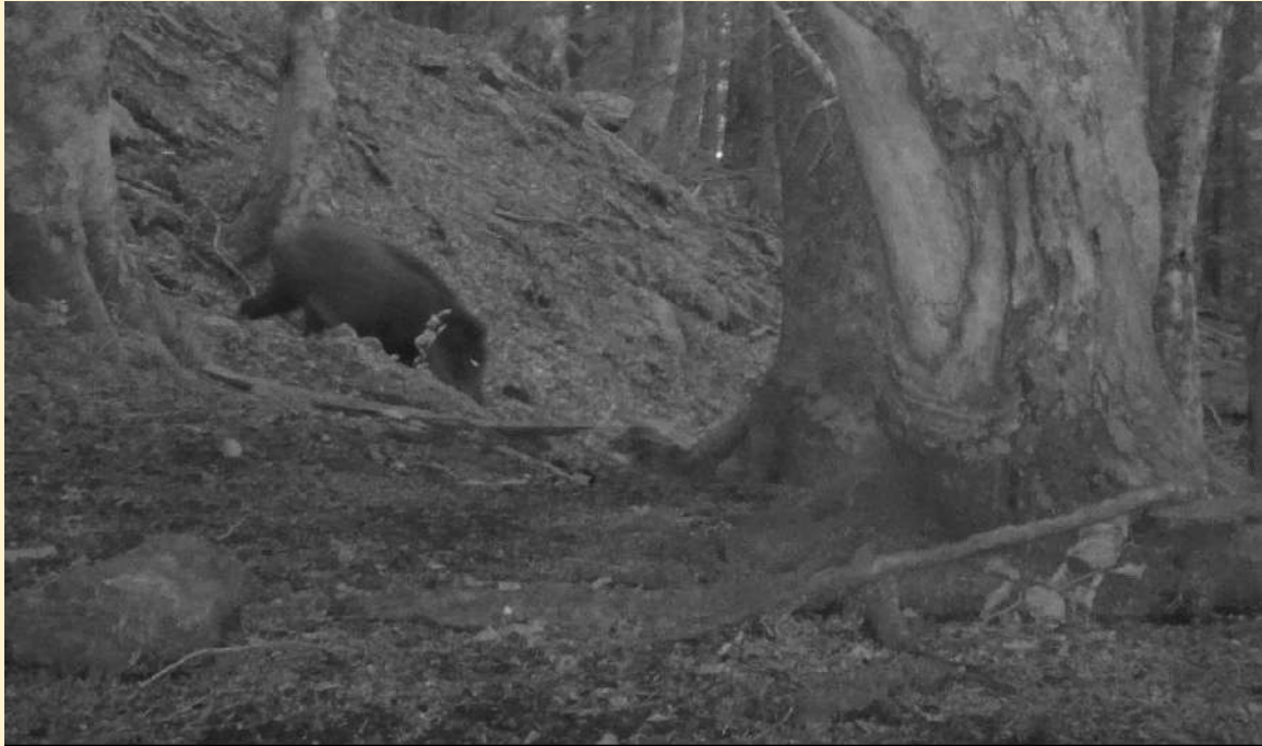
Sanglier marqué, le 15/09/2024