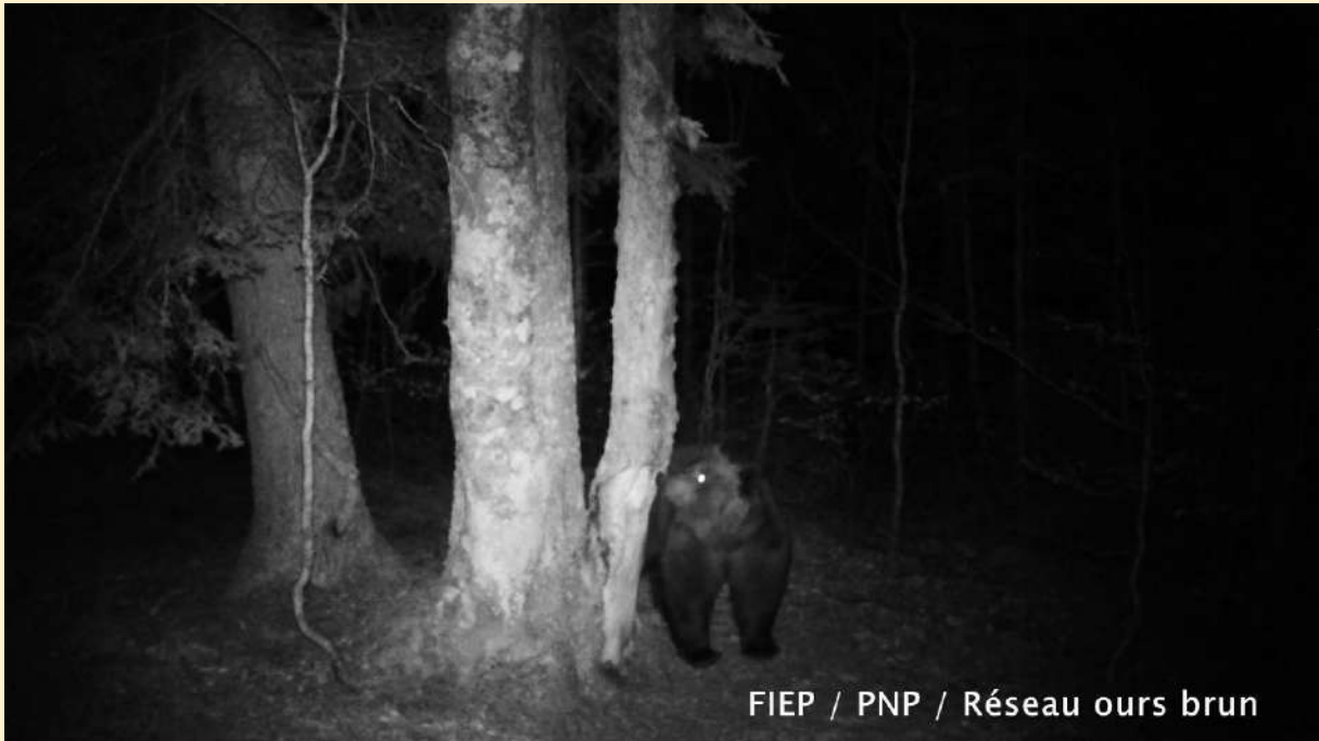
Ours mâle (probable Rodri), le 07/04/2024