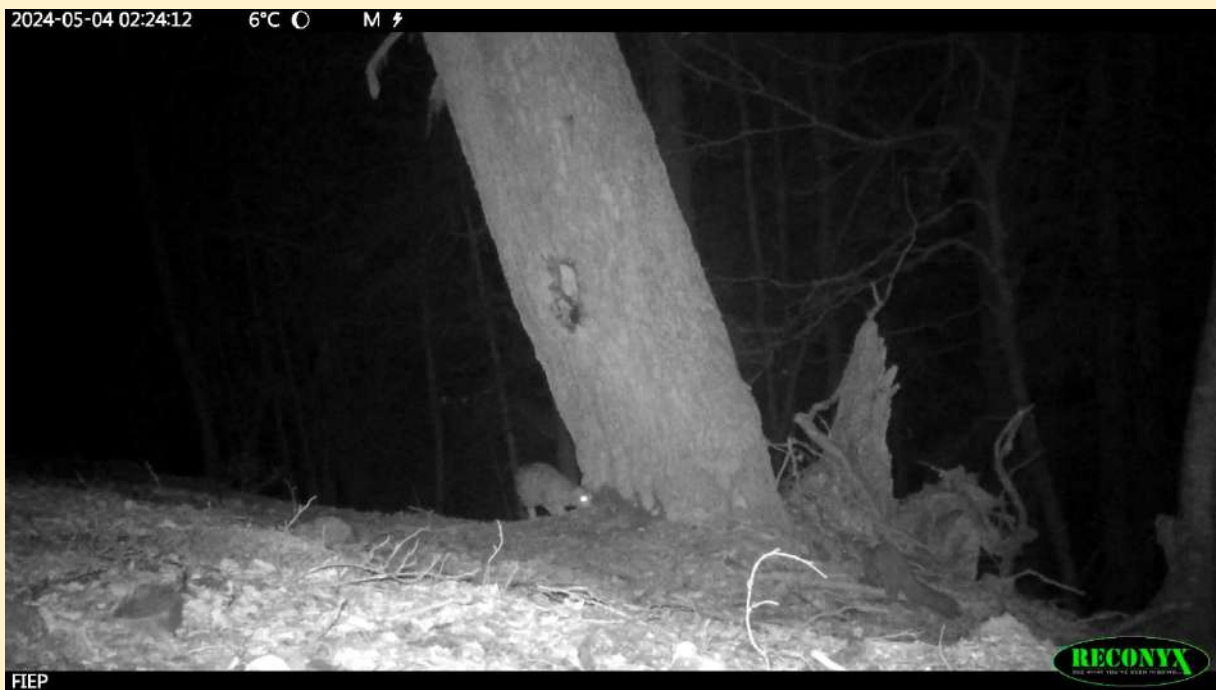
Interaction chat forestier et martre, le 04/05/2024