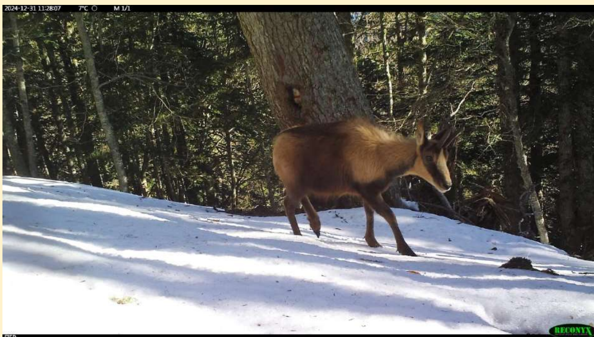
Isard, le 31/12/2024