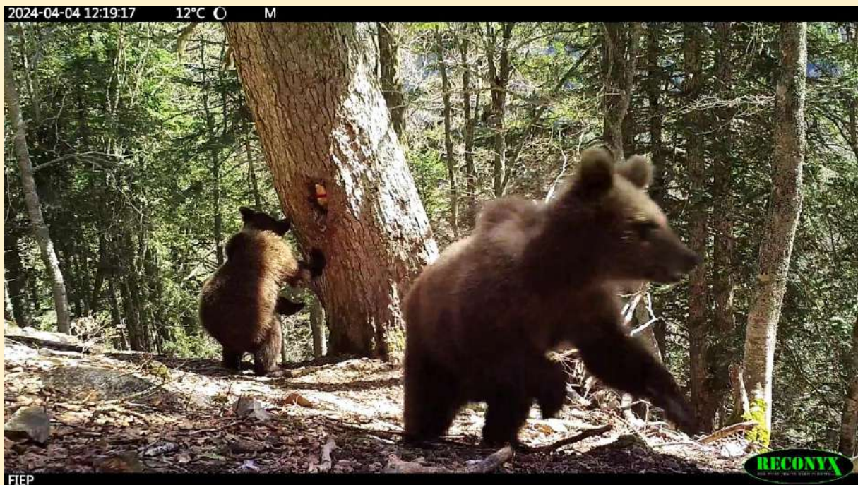
Gros plan de l'autre jeune né en 2024, le 04/04/2024