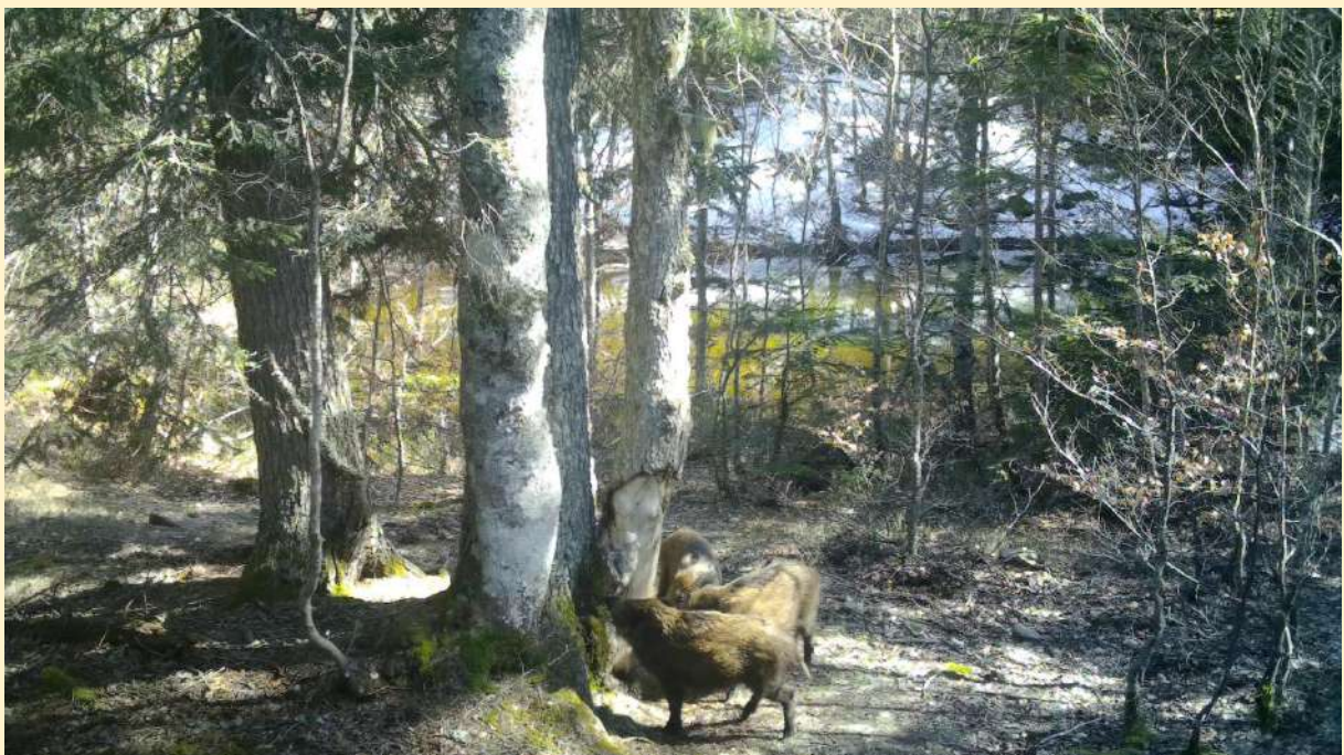
Marcassins le 11/04/2024