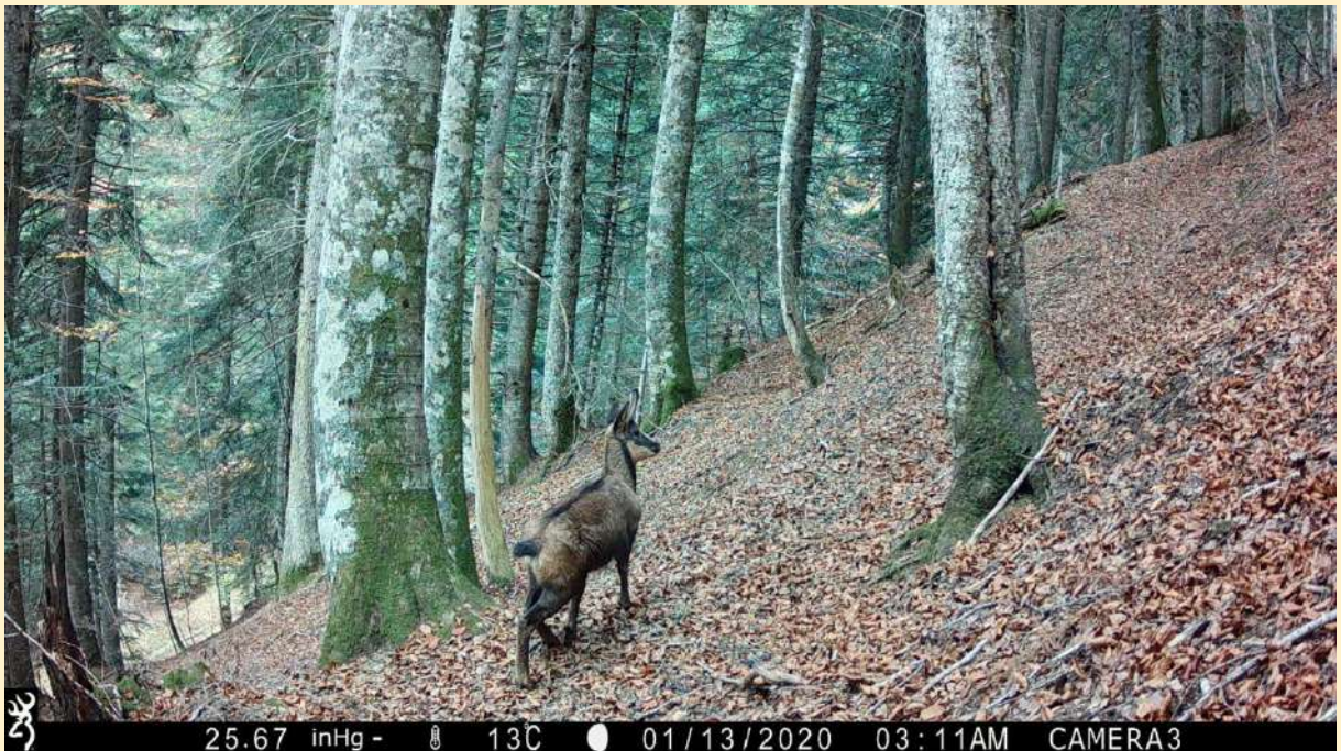
Jeune isard, le 03 /11/2024