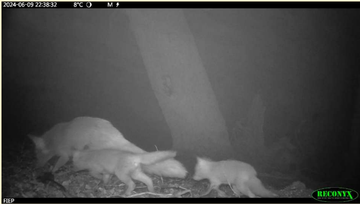
Renarde et 2 renardeaux le 09/06/2024