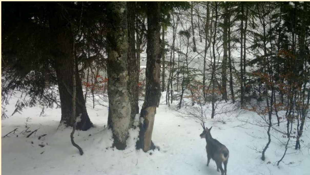
Isard, le 13/03/2024