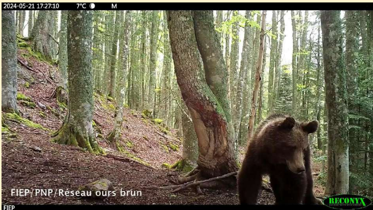
Jeune ours, né en 2024, le 21/05/2024