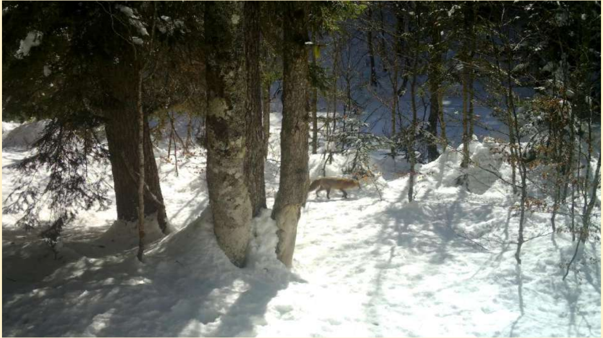
Renard, le 06/03/2024