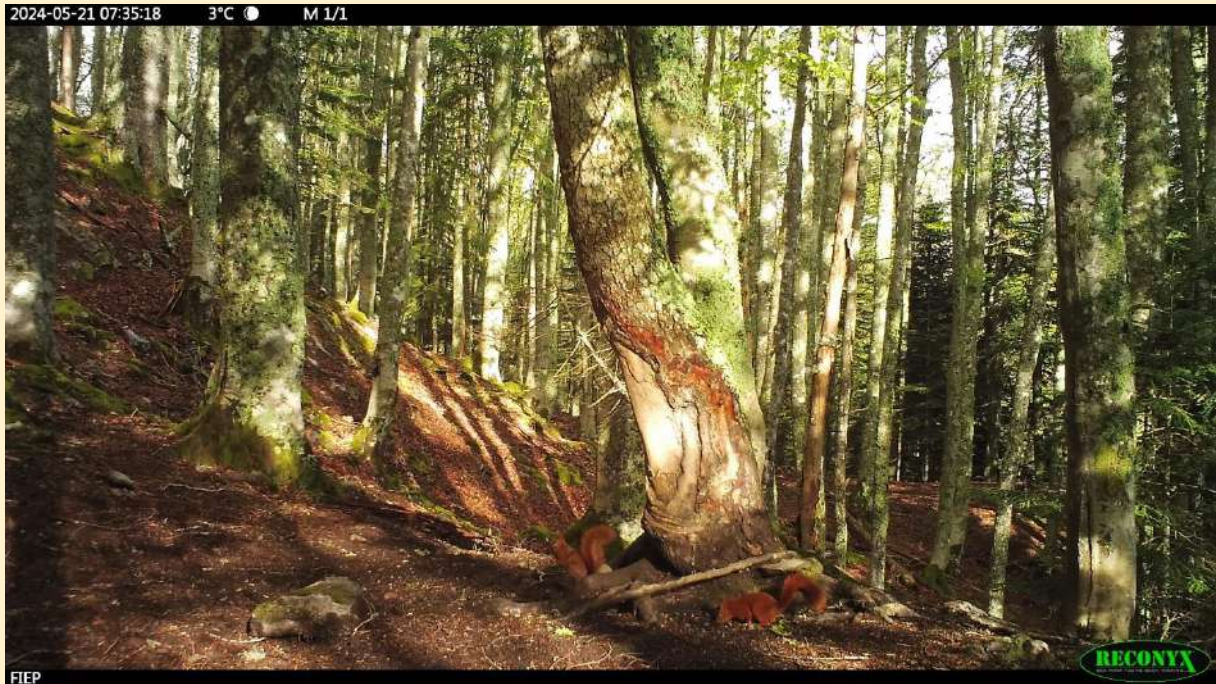
2 écureuils, le 21/05/2024