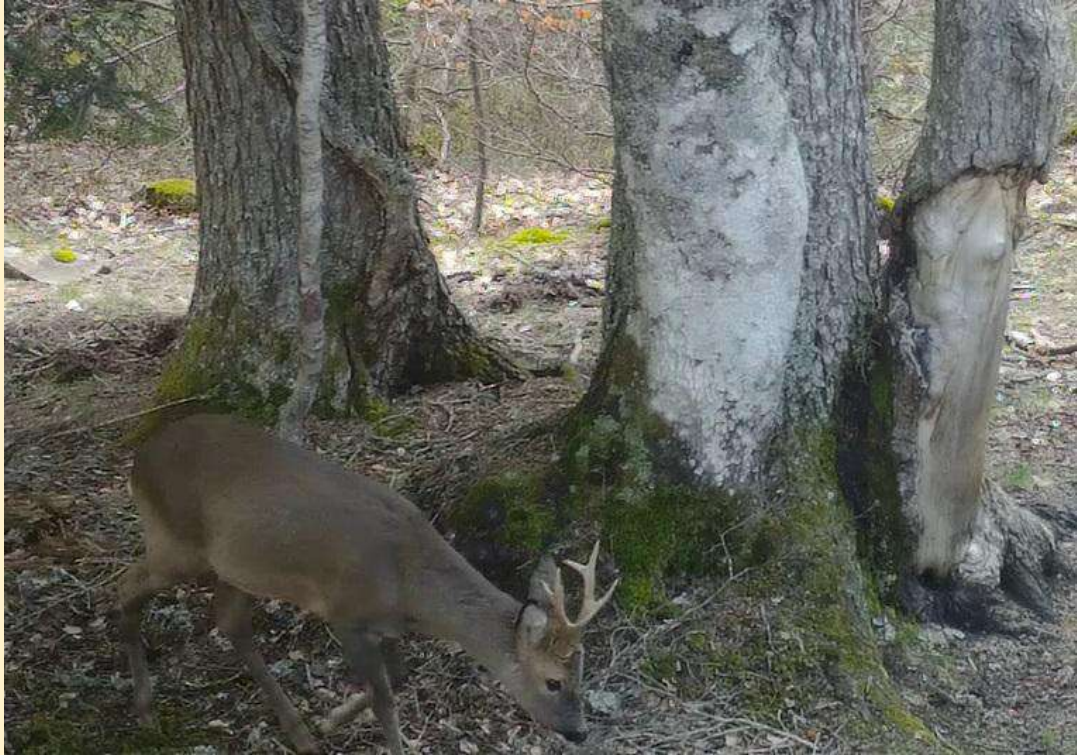
Chevreuril mâle, le 28/04/2024