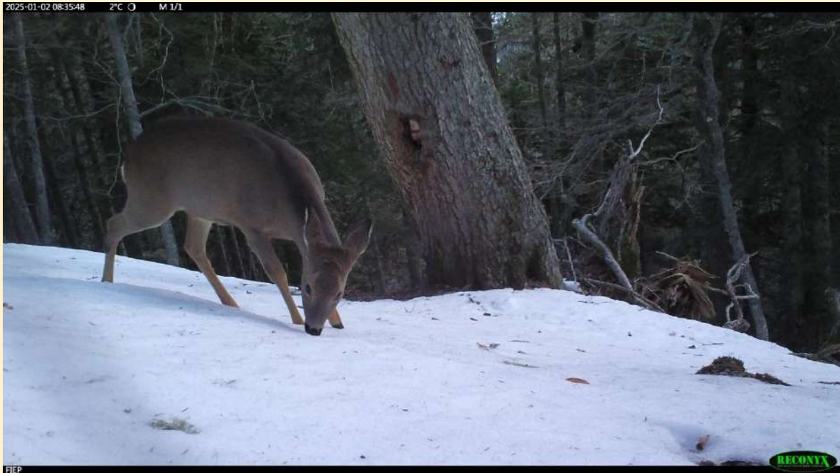
Chevreuril femelle , le 02/01/2025