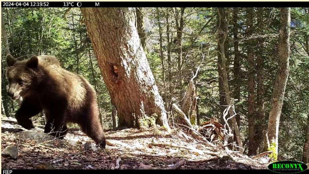
Gros plan de l'un des 2 jeunes, nés de Sorita en 2024, le 04/04/2024