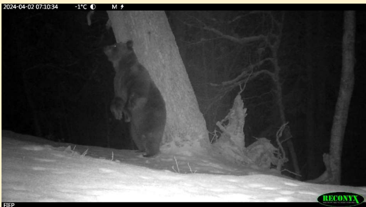
Ours Rodri 02/04/2024