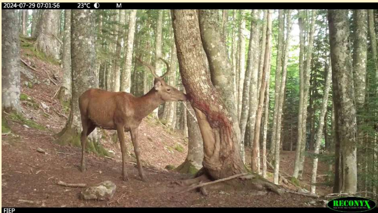
Cerf à corne difforme, le 29/07/2024.