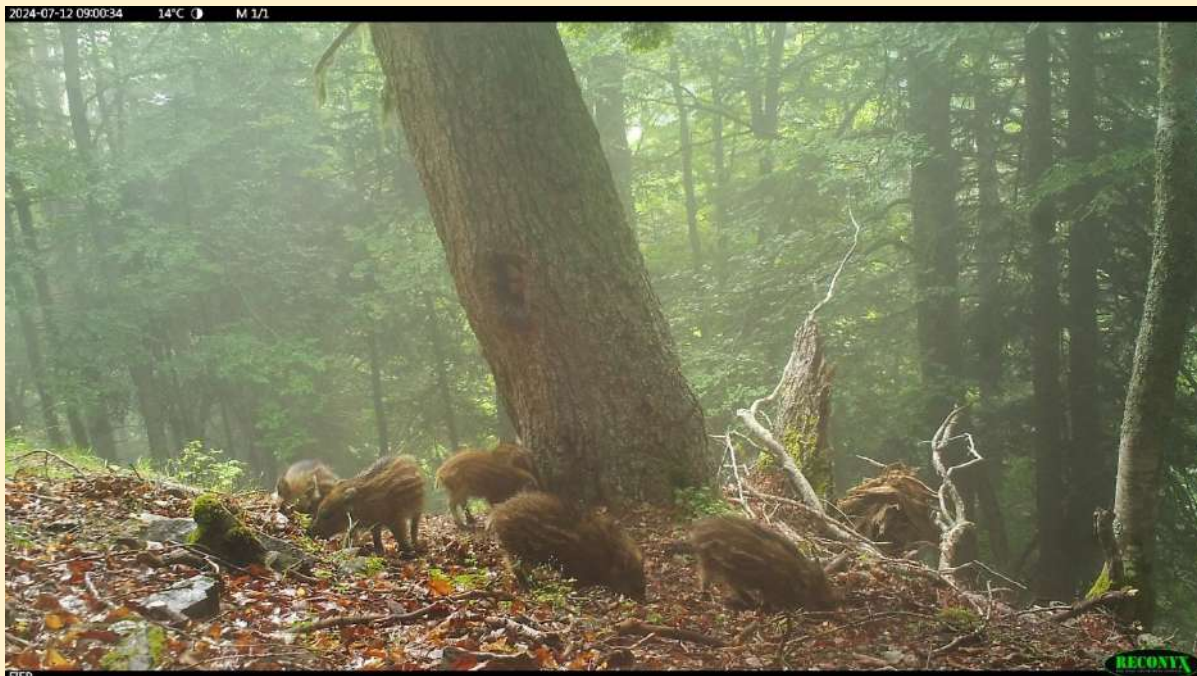
Marcassins, le 12/07/2024