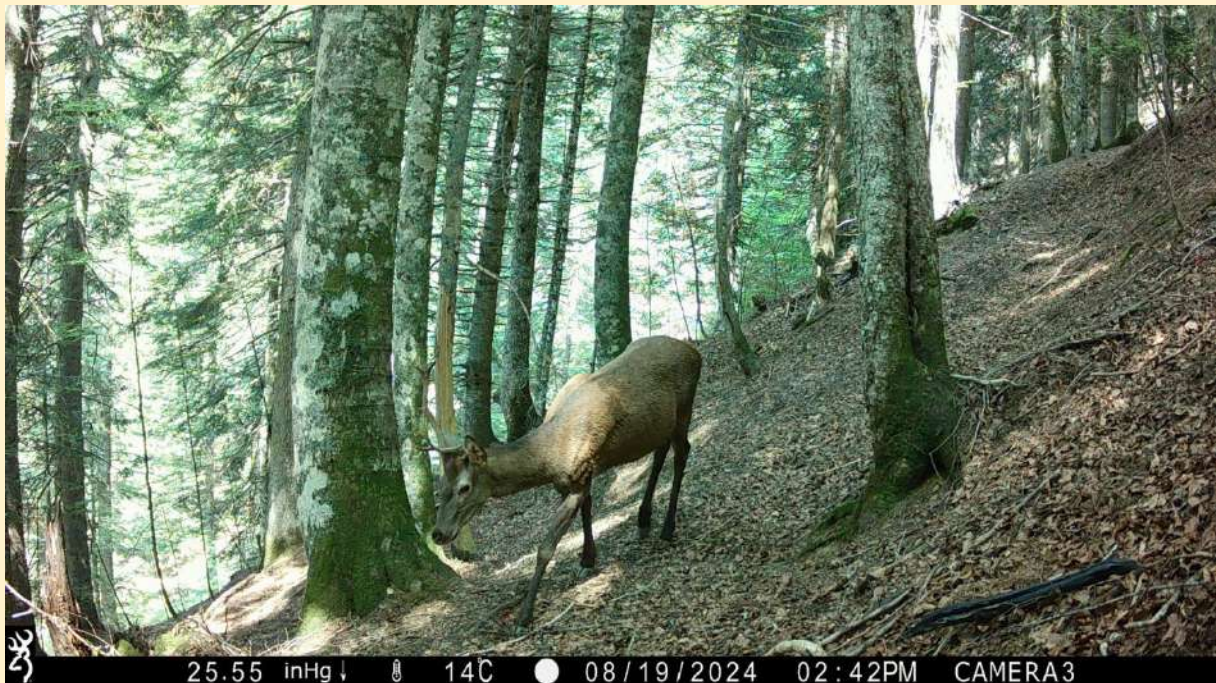
Cerf mâle adulte, avec corne difforme, le 19/08/2024