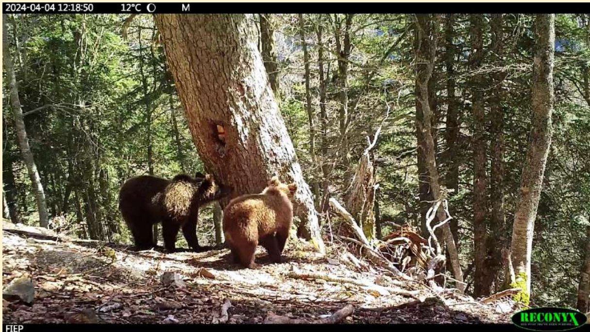
Les 2 jeunes ours nés en 2024 de Sorita, le 04/04/2024