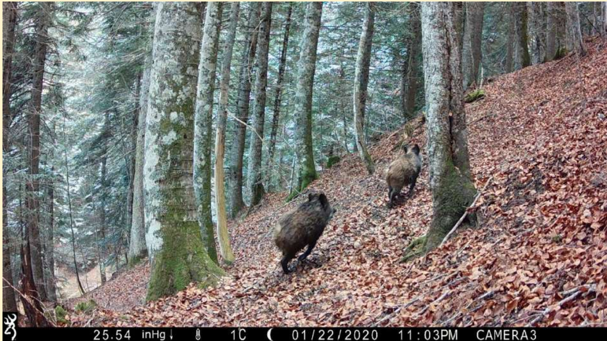
Sangliers, le 12/11/2024