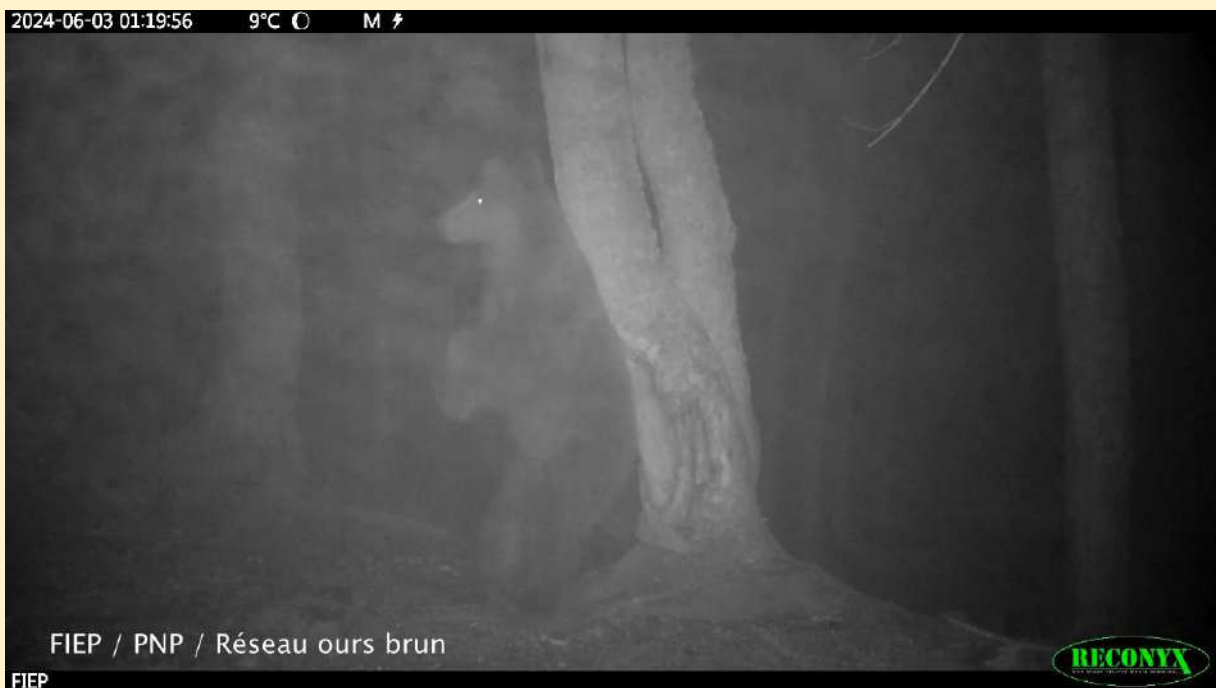
Jeune ours, né en 2024, le 03/06/2024