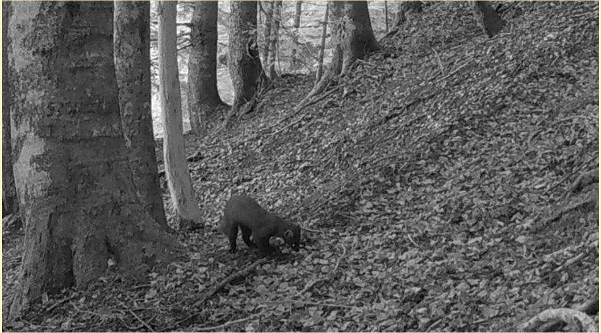
Martre, le 05/07/2024