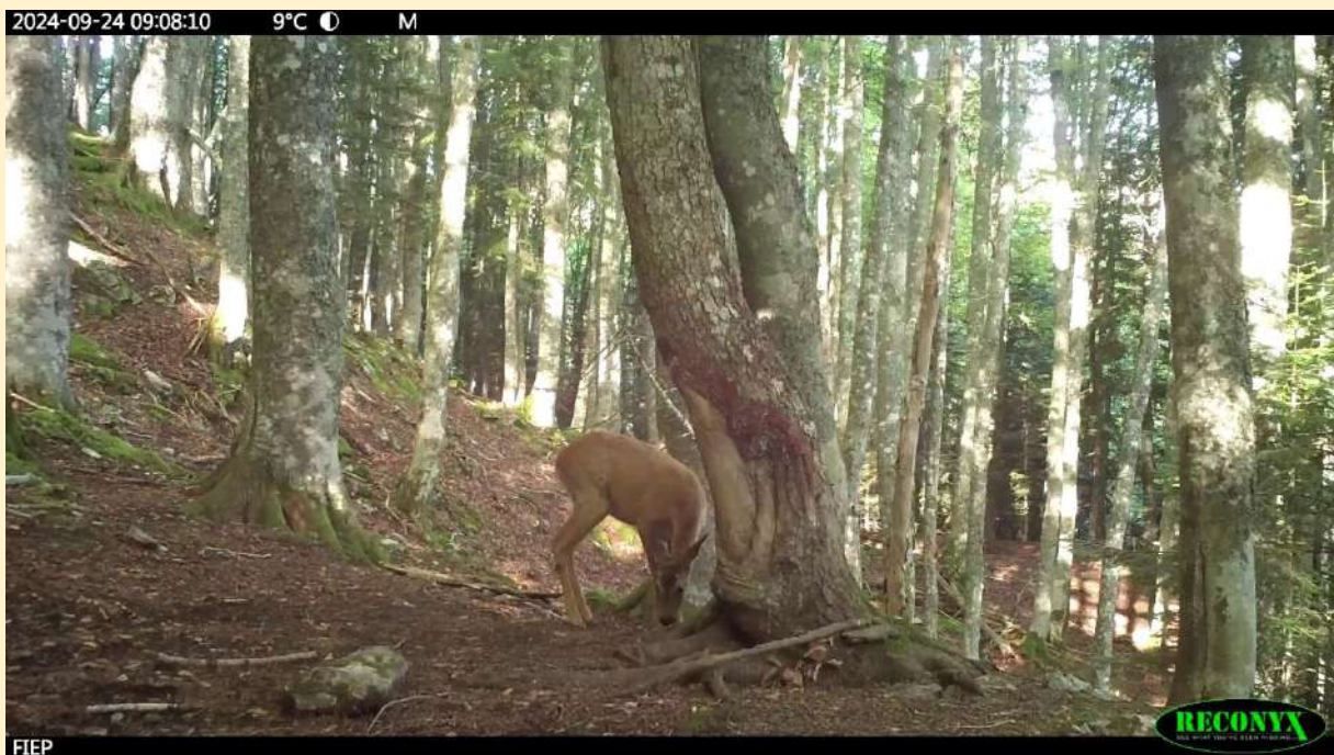
Chevreuril femelle, le 24/09/2024