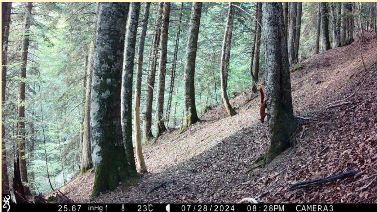
Ecureuil le 28/07/2024