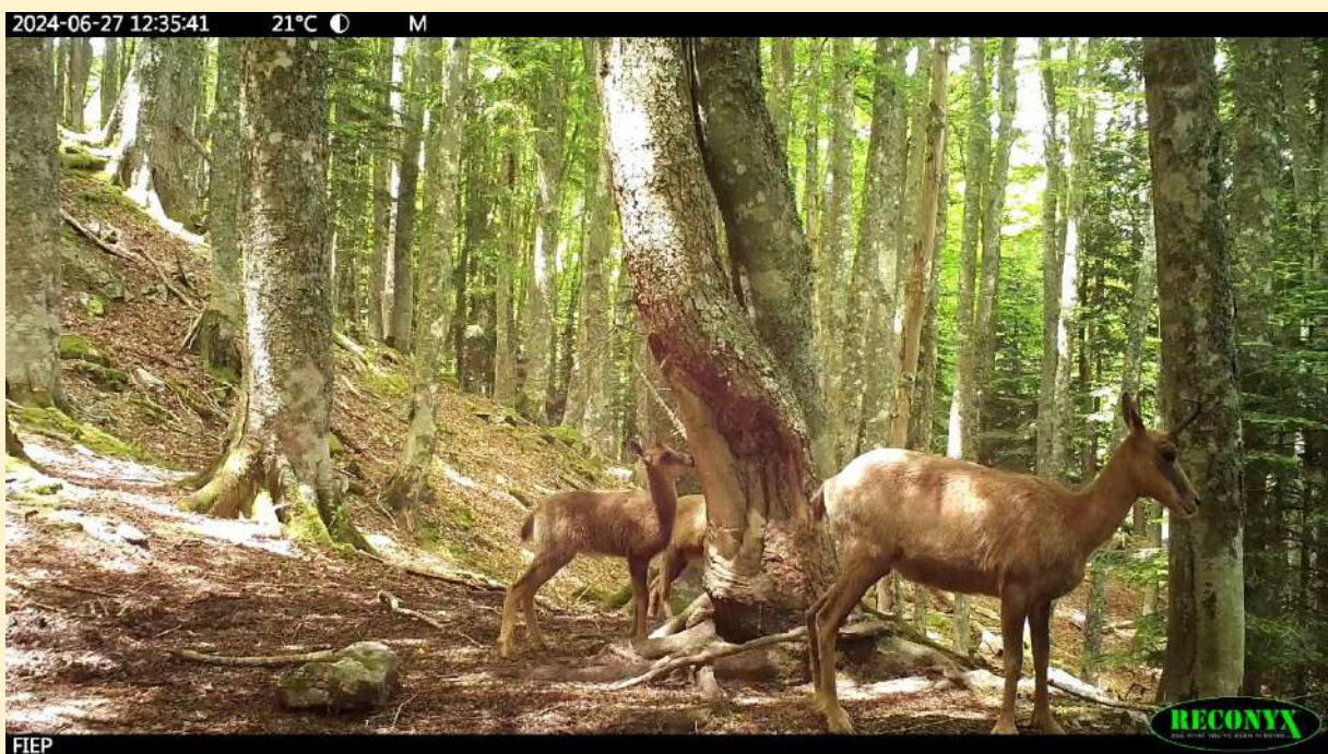
Femelle et jeunes isards de l'année, le 27/06/2024.