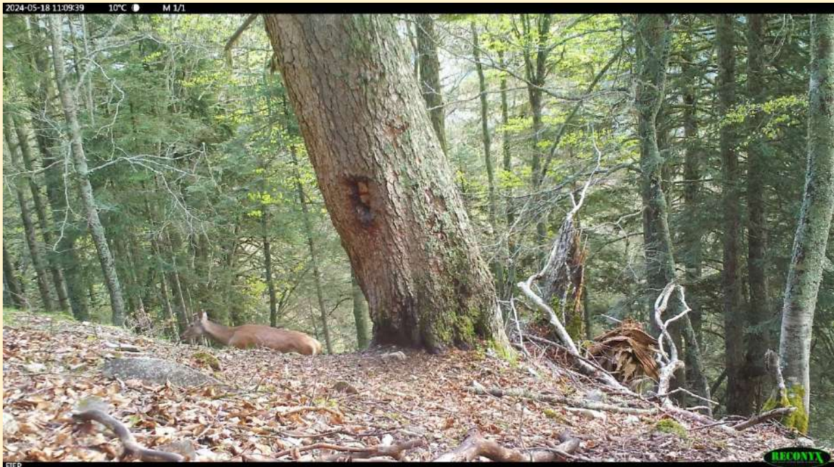
Jeune cerf mâle le 18/05/2024