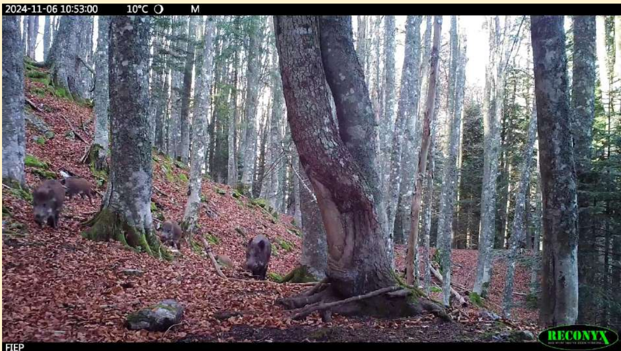
Famille de sangliers 06/11/2024