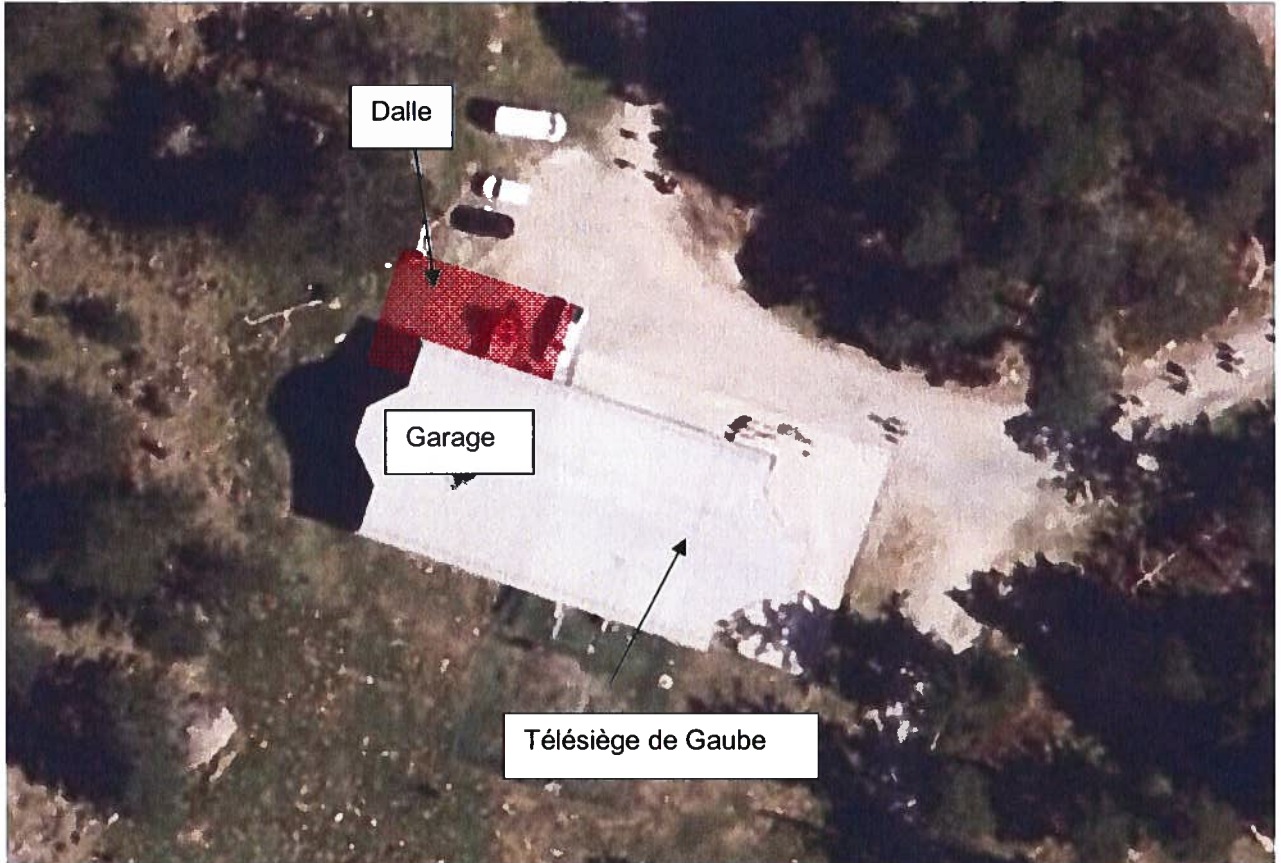
Plan de la dalle et évacuation

Le site concerné par la présente autorisation est le suivant identifié en rouge ci-dessous :