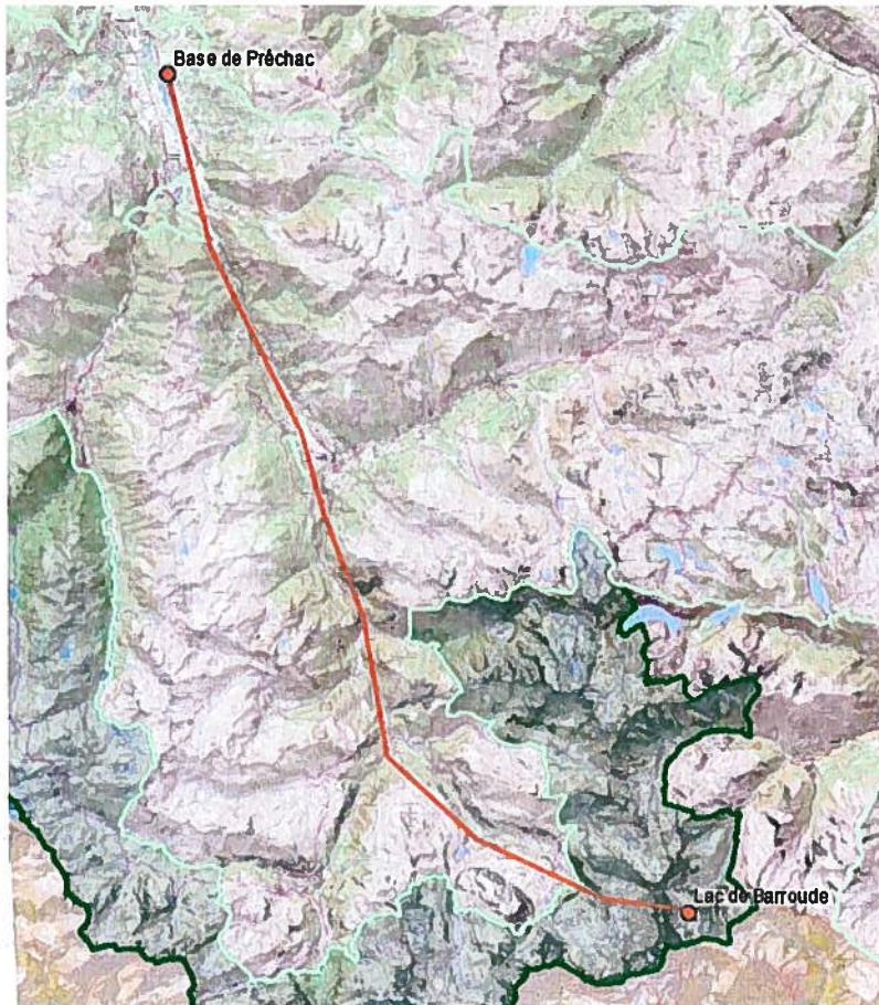
Figure 1 : Plan de vol