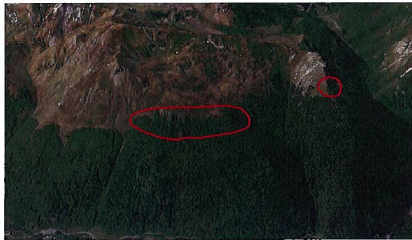
Figure 1 : Localisation des aménagements prévus